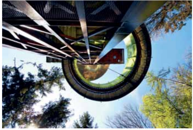
Alle botanische tuinen in Nederland. Meer informatie zie: ww.botanischetuinen.nl